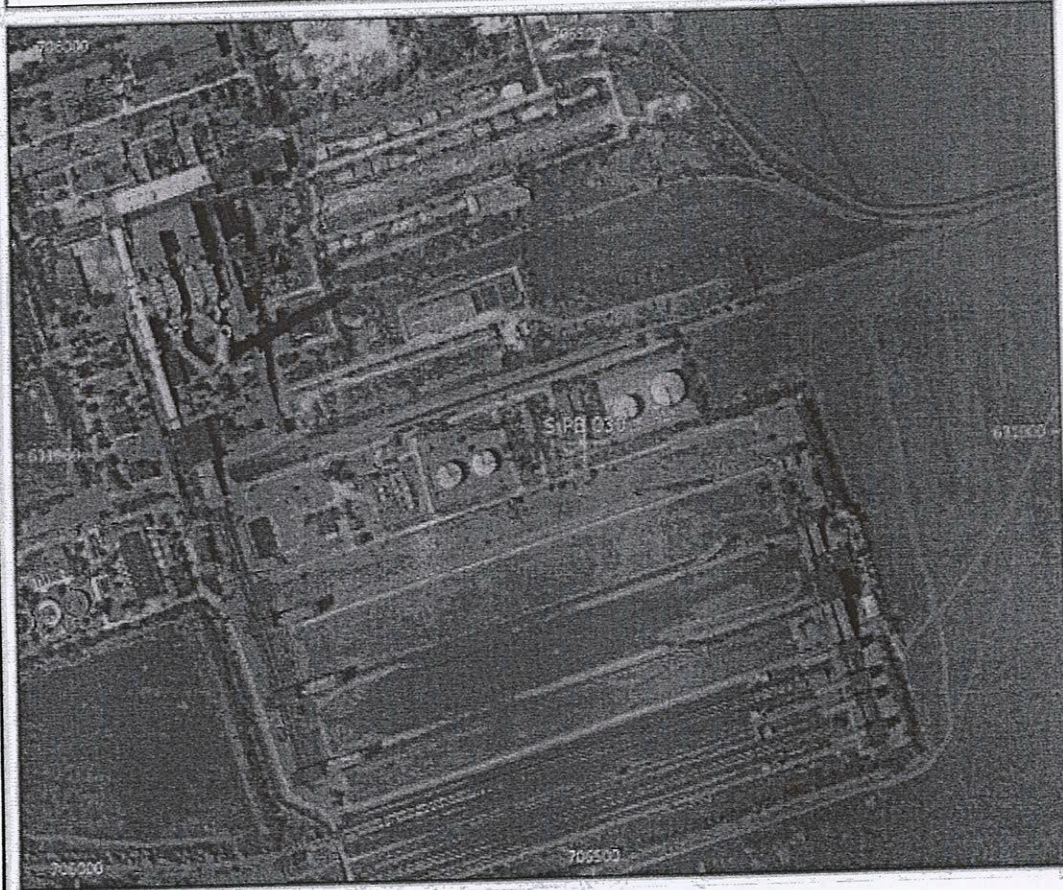
Amplasament sirenă - Faza HCL