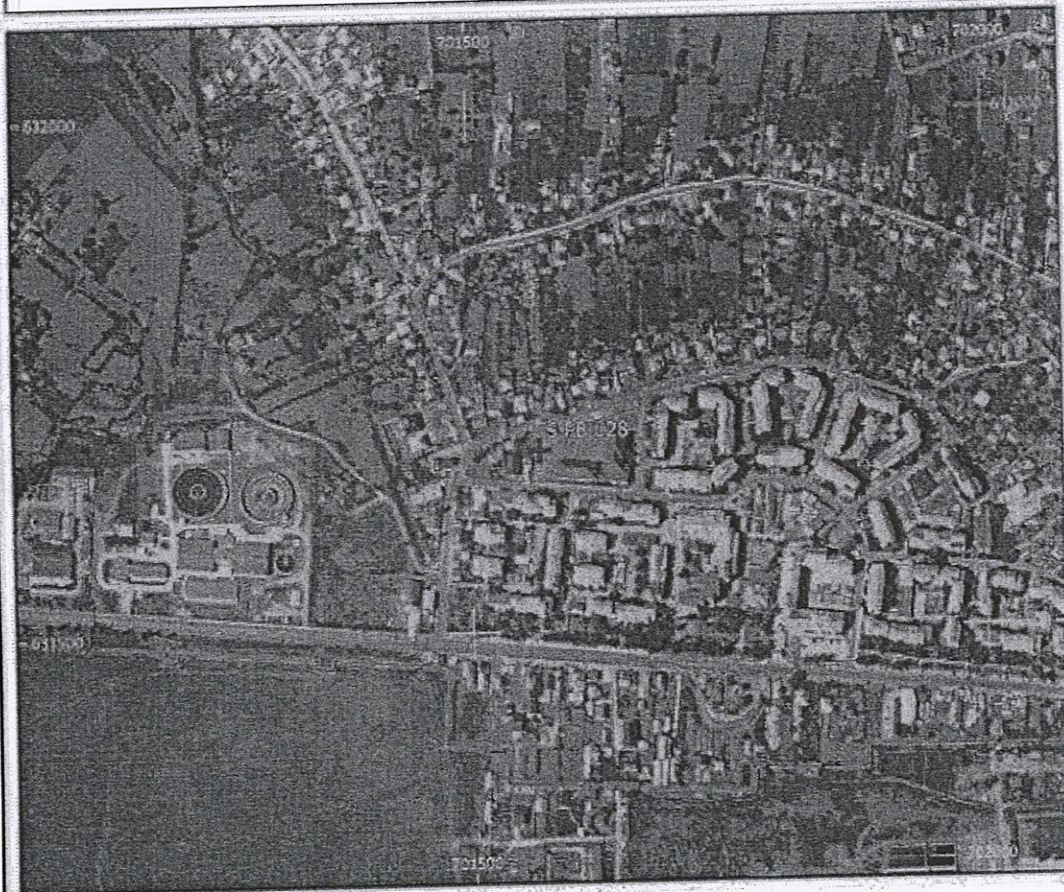
Amplasament sirenă - Fara HCL