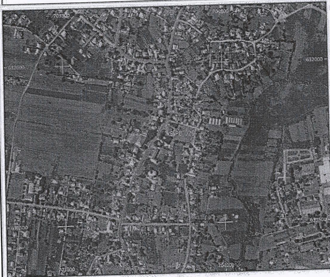
Amplasament sirenă - Fara HCL