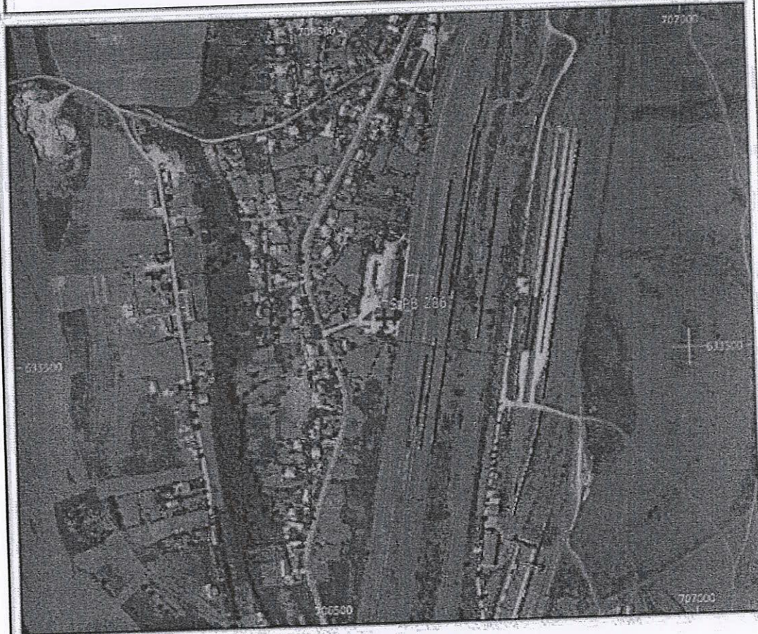
Amplasament sirenă - Faza HCL