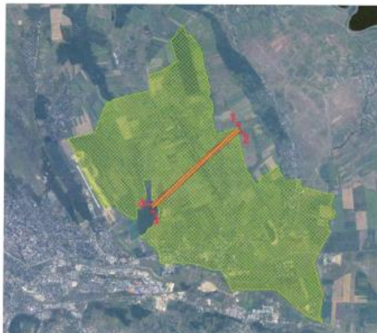
Tabel coordonate Stereo 1970, pentru zona 1 de restricție