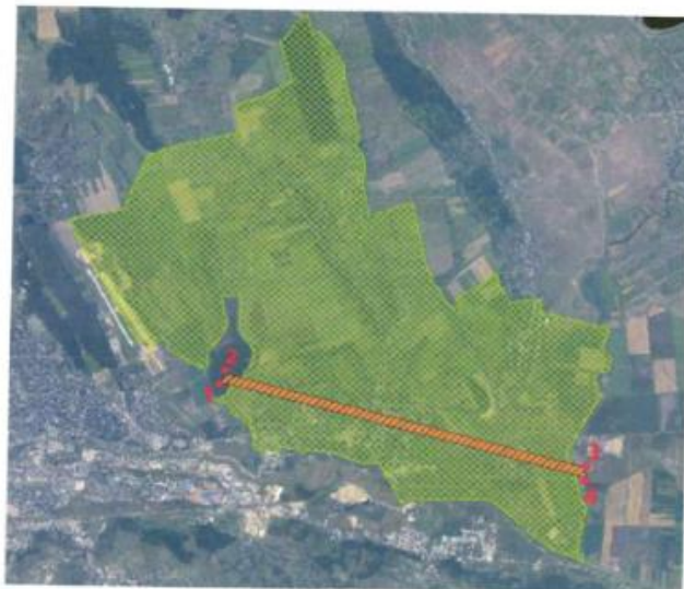
Tabel coordonate Stereo 1970, pentru zona 2 de restricție

- in Zona 2 de restructie MAI nu se admit constructii cu regim de înalțime mai mare de 40,00m fata de cota terenului natural: